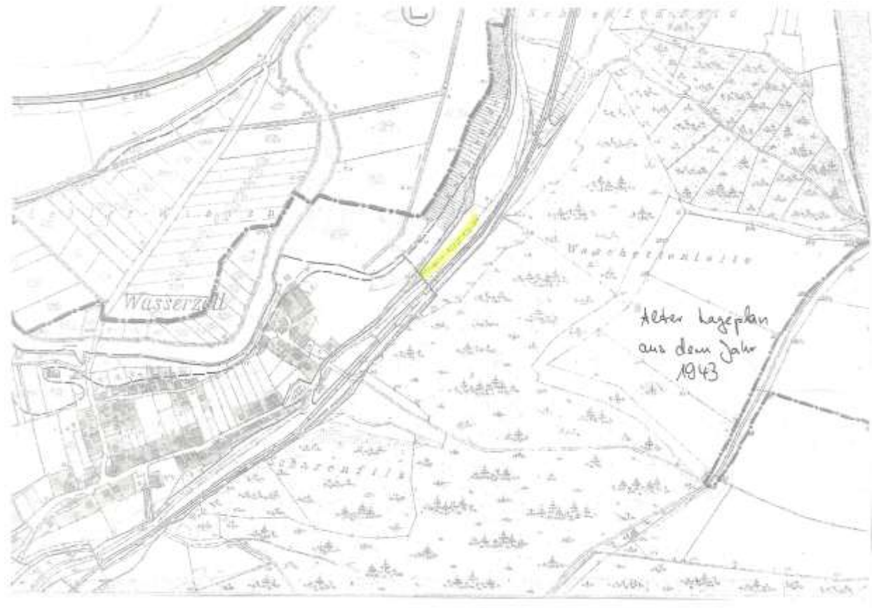
Anlage zu Nr. 59