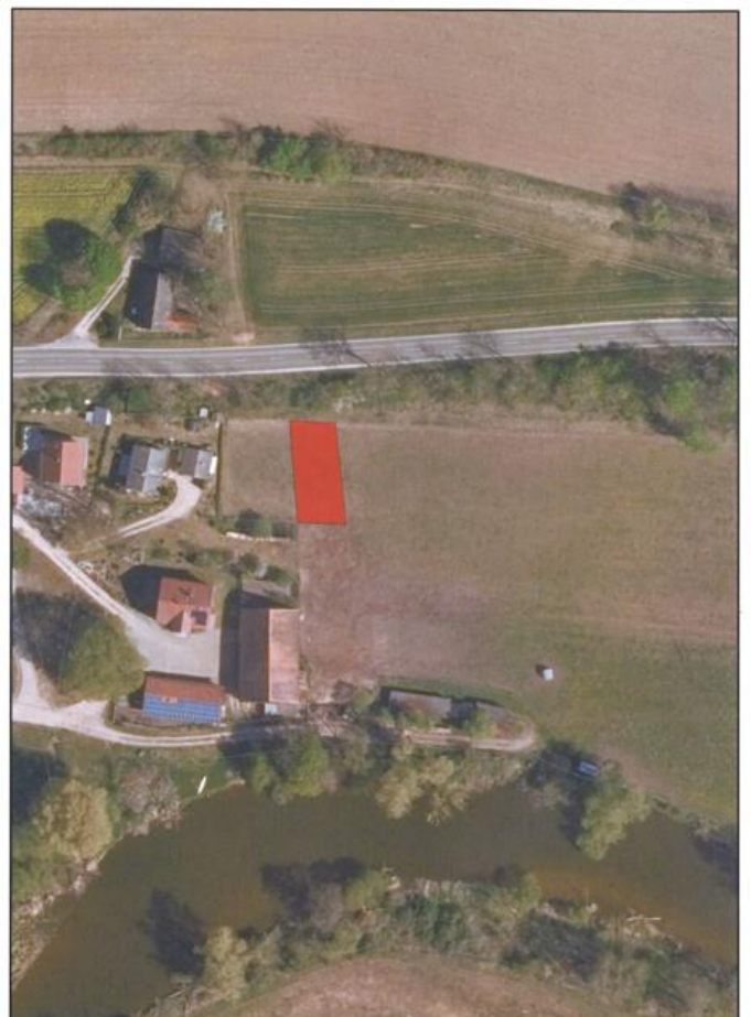
Maßstab M 1:1.000 (1 cm = 10 m)