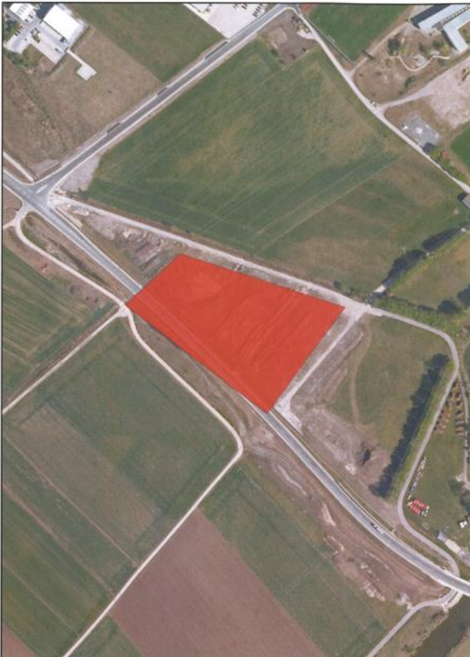
Maßstab M 1:2.500 (1 cm = 25 m)