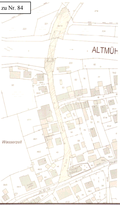
Anlage zu Nr. 84

Briickenstraße, Rebdorfer Weg, Fl.-Nrn. 38125, 38114 Gemarkung Wasserzell (Kum 0,302).