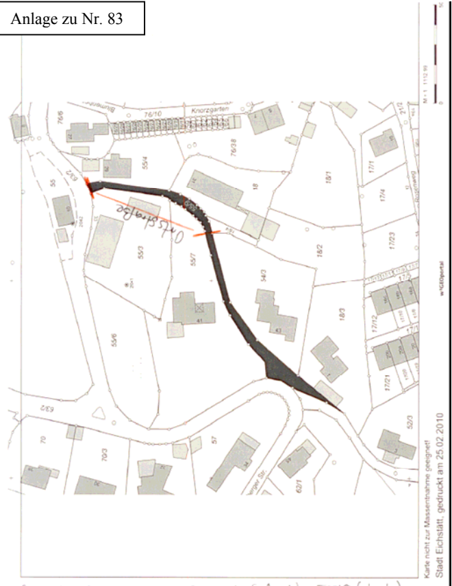
Anlage zu Nr. 83

Karte nicht zur Massentnahme geeignet Stadt Eichstätt, gedruckt am 25.02.2010