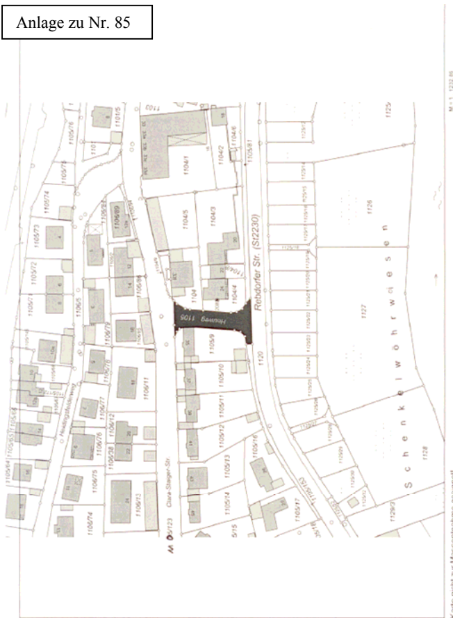
Anlage zu Nr. 85

Karte nicht zur Massentnahme geeignet Stadt Eichstätt, gedruckt am 18.02.2010