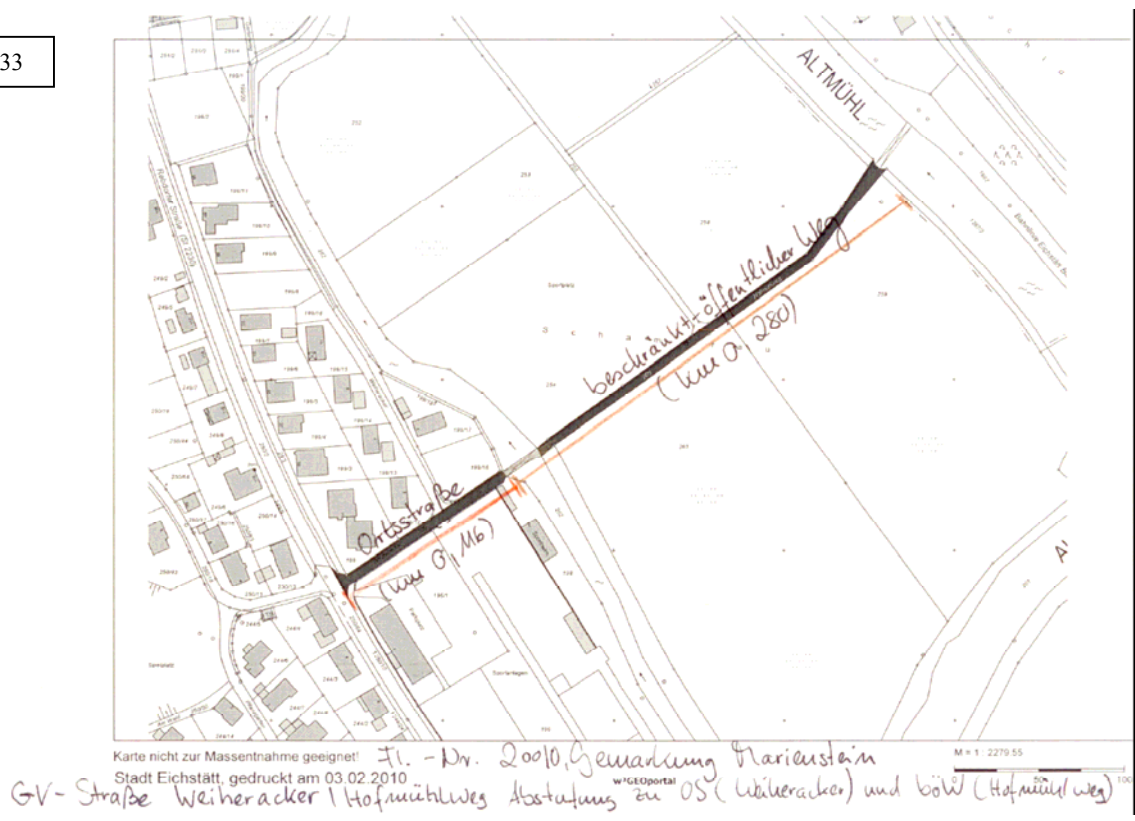
Anlage zu Nr. 32 und 33

Titting, 10. Februar 2010 gez. Böhm, Verbandsvorsitzende