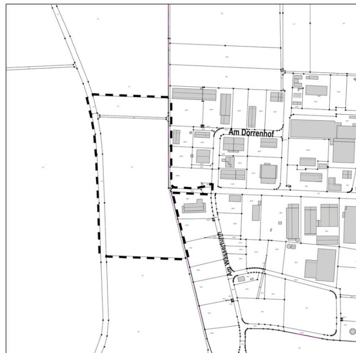
Lageplan zum Bebauungsplan Nr. 75 "Gewerbegebiet Zachenäcker III"