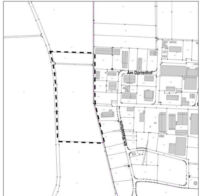
Lageplan zur 21. Änderung des Flächennutzungsplans für den Bereich „Gewerbegebiet Zachenäcker III“