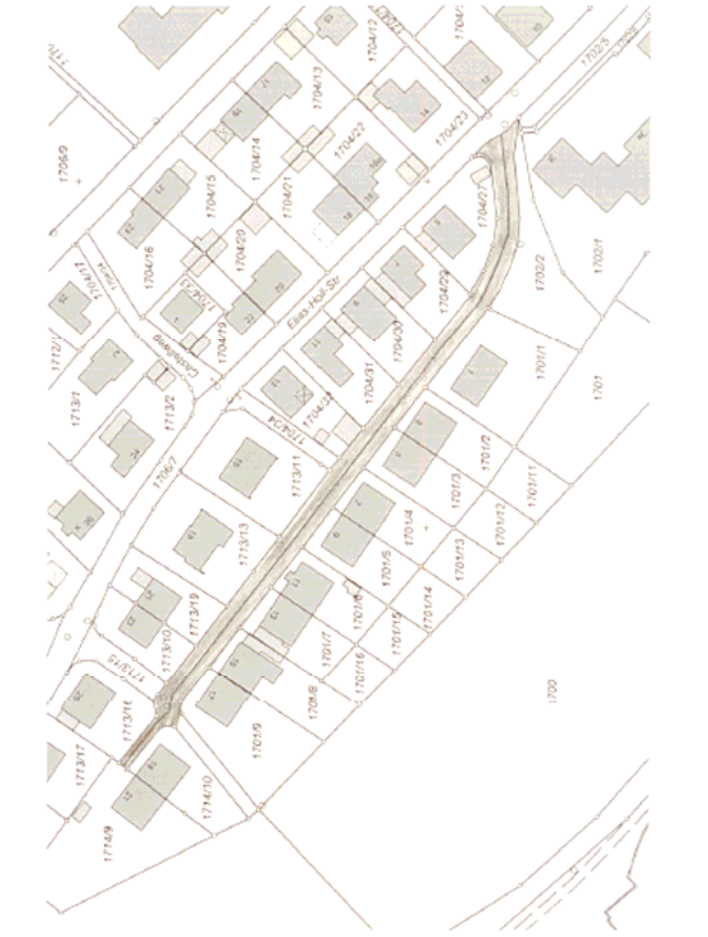
OS Oettingenstraße, Fl.-Nr. 170618 (Teils), Gemarkung Eichstätt (km 0, 220).